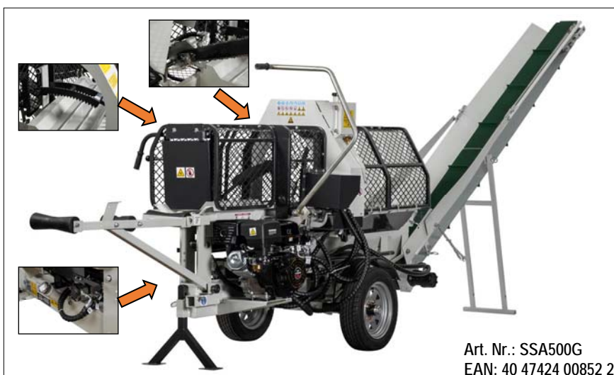
Art. Nr.: SSA500G EAN: 40 47424 00852 2